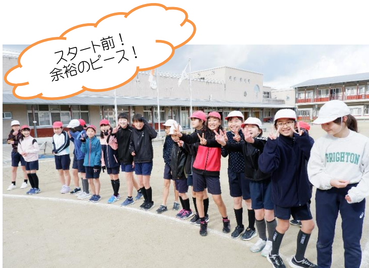
スタート前！ 余裕のピース！