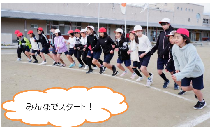
みんなでスタート！