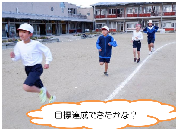
目標達成できたかな？