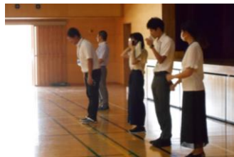
担任団がはじめに一言