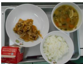
8/3 キムタクごはん トック

<今週の給食から> 8月の1学期最後の給食もコロナ対応の献立が続きました。2学期からは徐々に、これまで通りの給食の献立にしていくと聞いております。給食の配膳方法にも慣れてきました。1品増えることを楽しみにしながら、コロナ対策は引き続き継続していきます。コロナで臨時休業が続いただけに、いつも以上に学校給食のありがたみを感じる1学期になりました。おいしい給食を提供していただいた皆様に感謝して、1学期最後の五目ごはん給食をおいしくいただきました。ごちそうさまでした。