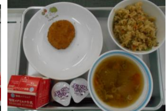
8/6 五目ごはん キャベツ入りメンチカツ トウガン汁 ミニぶどうゼリー