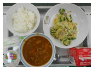
8/4 カレーライス ポテトチップスサラダ 蒲郡みかんゼリー