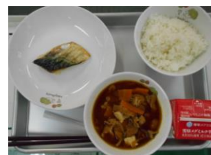
8/5 サバの塩焼き カボチャの味噌汁