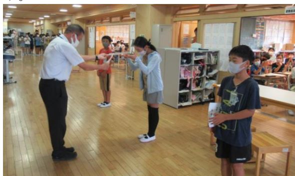
★5年生の任命の様子