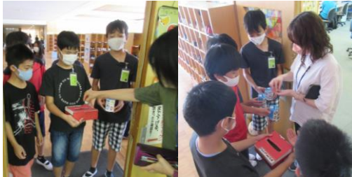
10/6・・・職員室で募金を呼びかける福祉委員