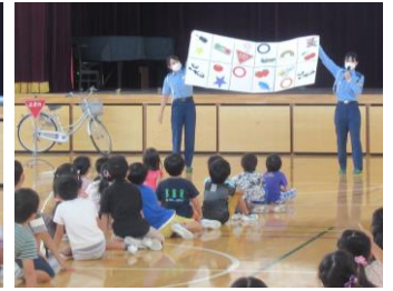
★1秒で確認！わかるかな？