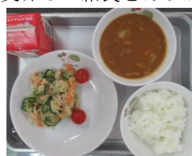
10/6 カレーライス チキンサラダ ミニトマト