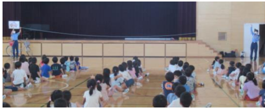
★車は急に止まれない！11mは実際にはこれくらい！