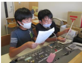
10/5「明日が最後です」と、昼の放送で協力を呼びかける福祉委員