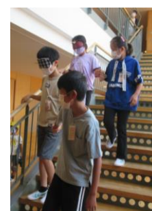
ガイドヘルプ体験