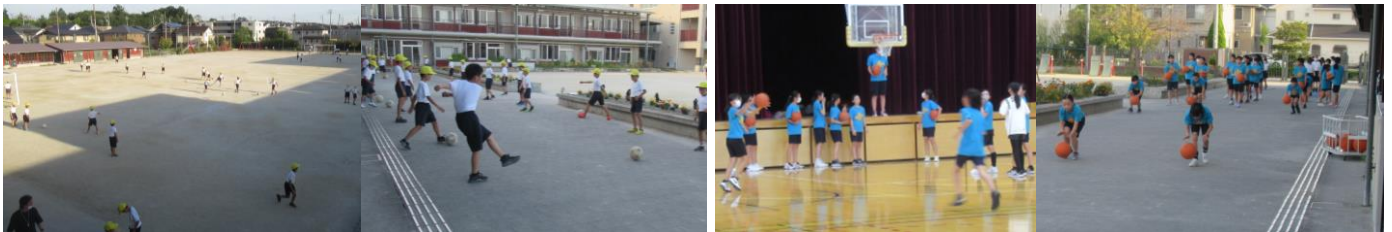
★サッカー部5・6年生と4年生の様子

今日からサッカー・バスケットボール・金管バンドの全ての部活動が再開されました。久しぶりの部活動に子どもたちも生き生きとしていました。徐々にレベルアップを図っていきます。