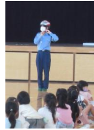
★ヘルメットのあごひも！