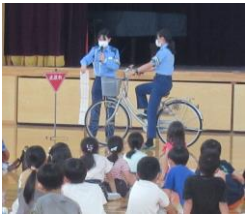
★白線手前で必ず止まる！

愛知県警察本部から講師の方を迎え、1年生が交通安全教室を行いました。1年生が全員集まって1時間お話を聞く体験は今回が初めてかもしれません。道路を渡るときに気をつける3つのポイント「止まれ・みる・まつ」や、自転車の点検「ブタハトシャベル」についてなど、交通安全についておまわりさんからしっかりと学びました。