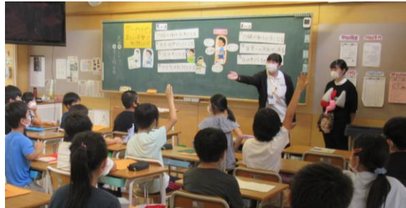
10/7 「ゲー・ベタ・ピン」正しい姿勢で勉強しよう！と、ミニ保健指導を多くのクラスで行いました。

★10/8までの1週間という短い期間ではありましたが、子どもたちとの触れ合いやミニ保健指導、保健室での実習など、よい経験になったのであれば幸いです。