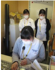
10/4 昼の放送で自己紹介しました。