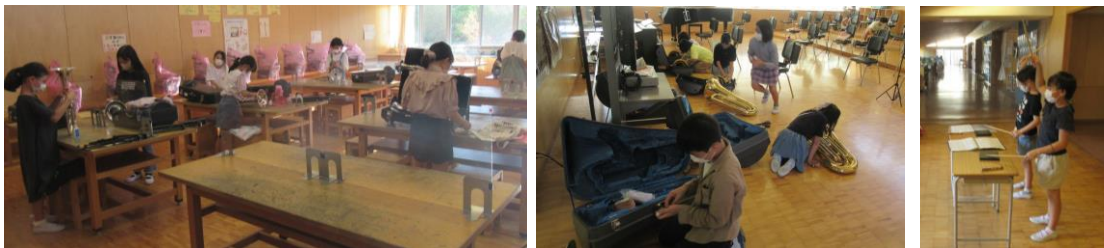
★金管バンド部：久しぶりの部活動。楽器の準備から始めていました。