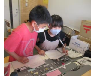
10/7「57,102円集まりました。」と協力へのお礼を放送する福祉委員