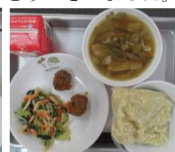
10/7 ちゃんぽんメン 豆腐団子 もやしのナムル