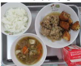
10/4 豚肉のショウガ炒め けんちん汁 大学いも

今週は「豚肉のショウガ炒め・えび団子の薄くず汁」が大変お気に入りの味でした。わたくし的にはえび団子と薄くず汁の絶妙なバランスが週末の疲れを癒やしてくれました。来週は「鶏肉の風味焼き・イタリアンスパゲティ・栗おこわ・さばの銀紙焼き・ホイコーロー」と毎日が楽しみです。栗おこわにスイートポテトもでる13日は最高だ～！と思いきや・・・13・14日は修学旅行でした。食べられないのは残念ではありますが・・・栗おこわ以上に美味しいお昼を楽しむにしました。今週も美味しい給食をありがとうございました。