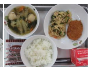
10/8 おからコロッケ 切り干し大根の和え物 えび団子の薄くず汁 乾燥小魚