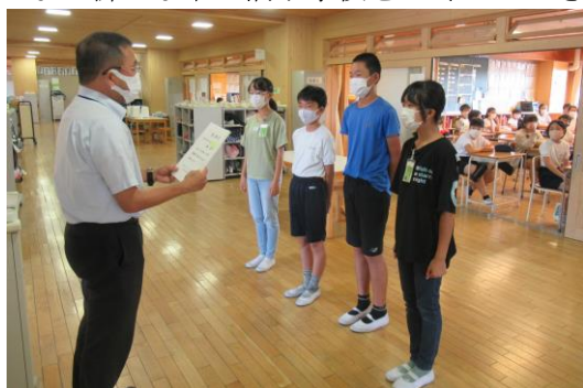
★6年生のワークスペースにて

放送朝会のあとは6・5年生のワークスペースにて、児童会役員に任命状を直接渡しました。7名からは後期に臨む意欲が伝わってきました。各フロアーでは大きな拍手が起きました。みんなで新たな市が洞小学校をつくっていきます。