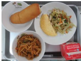
10/12 小型ロールパン イタリアンスパゲティ オムレツ ごぼうサラダ