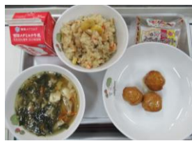
10/13 栗おこわ 愛知の肉だんご さわにわん スイートポテト