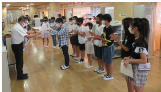
★6年生各委員長の任命

その後、委員長と学級委員（4～6年）の紹介があり、ワークスペースにて、各委員長と学級委員の代表に任命状を渡しました。クラスや学年みんなで頑張っていこうという気持ちを、大きな拍手からも感じられました。