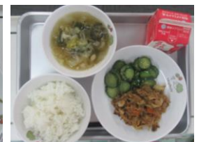
10/15 ホイコーロー 中華スープ キュウリのごま醤油