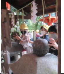
★ホテル「平安の森」にてカレーライス完食！ クラス別分散学習へ！ 4・5組：伏見稲荷大社の様子 「おもかる石」の願いごと