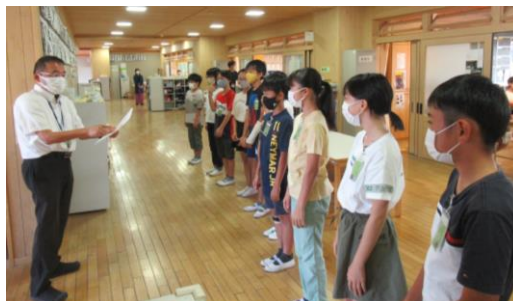
★6年生学級委員の任命