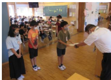
★4年生学級委員の任命