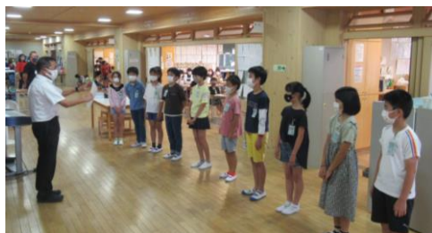
★5年生学級委員の任命