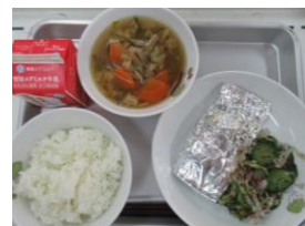
10/14 さばの銀紙焼き 赤しそ和え だんご汁