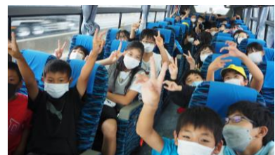
★出発式を体育館で行い、いざ出発です！