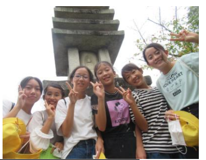
★清水寺へは全クラス行きました！ 清水の舞台に立ち、音羽の滝や仏足石など・・・、見どころ満載の清水寺でした。