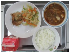
10/11 鶏肉の風味焼き ごま和え ご汁

今週は月曜日の「鶏肉の風味焼き」がご飯の進む濃い目の味つけで、大変美味しくいただきました。イタリアンスパゲティもグッドでした。栗おこわ&スイートポテトは残念でありませんが…修学旅行のお昼も最高でした〜!!今週も美味しい給食をありがとうございました。