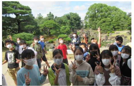
★最初の見学地「二条城」です。 床下もしっかり見てきました！ 見事な庭園をバックに1枚！📷