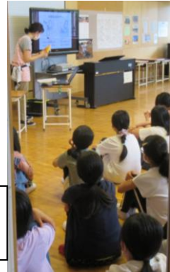
★9/30（木）6限に、6年生が修学旅行前の指導とともに、思春期の体や心の変化について学びました。正しい知識とともに、相手のことを思いやる心を大切に成長してほしいです。