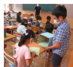
★各クラスの選挙管理委員の皆さんも役割をしっかりと果たしました！