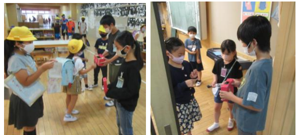
★2年生教室前で募金を呼びかける福祉委員

本日から来週の10/6(水)まで福祉委員会が募金活動を行っています。障害のある方や高齢者の方などがより暮らしやすくなるための赤い羽根共同募金に協力して、私たちのまち長久手の役に立とうと取り組んでいます。募金活動を通して福祉の心を考える機会になるといいです。