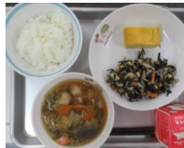
9/30 厚焼き卵 ひじきサラダ とりだんご汁