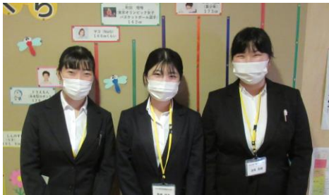
★愛知保健看護大学から3名が10/1～10/8まで実習を行います。学級は1の4、4の2、5の1に所属します。学校保健を中心に学び、所属する学年のミニ保健指導を行います。よろしくお願いします。