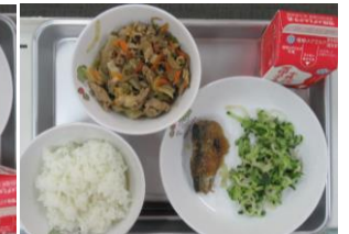
10/1 さんまのみぞれ煮 野菜たっぷり豚丼 はりはりづけ