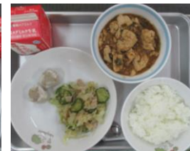
9/29 マーボー豆腐 シュウマイ かふう和え