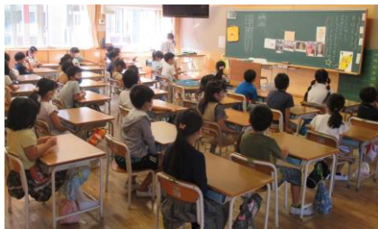
★放送朝会を聞く1年生

緊張感のある声でしっかりと自己紹介がありました。3週間の教育実習が実り多き時間となることを願いつつ、ともに切磋琢磨していこうという気持ちになりました。