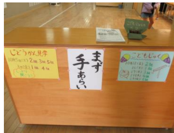
★昇降口から2年生のワークスペースに向かうとすぐに児童館見学や子ども塾に関する掲示があります。子ども塾だよりとともに見事な「栗」が添えられています。思わず食べたくなくなってしまいます！（*o*）