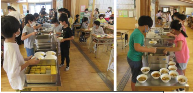
★9/30 給食準備中の様子（4年生・3年生）