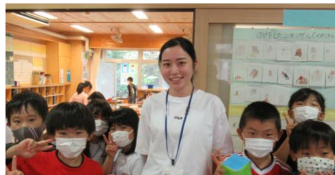
★2の5教室前で早速1枚！ 「よろしくお祈りします！」