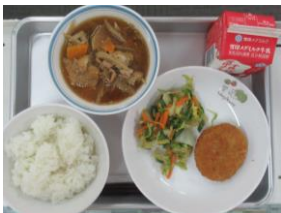
9/27 キャベツ入りメンチカツ おひたし 根菜のごま汁

今週は「メンチカツ・マーメレード焼き・シュウマイ・厚焼き卵・さんま」の1個物を楽しみにしていただけあって、とっても美味しくいただきました。「鶏肉のマーメレード焼き」と「さんまのみぞれ煮」はおかわりゲットに大満足です。来週は「豚肉のショウガ炒め・さわらの甘酢あんかけ・カレーライス・豆腐団子・おからコロッケ」とともに「けんちん汁」などの汁物も楽しみです。今週も美味しい給食をありがとうございました。