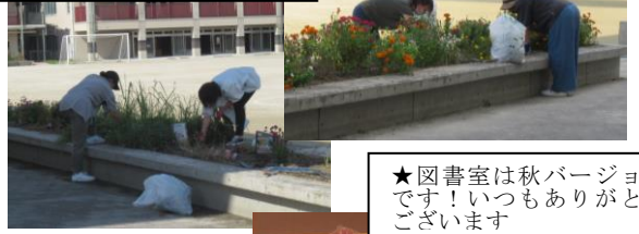
★図書室は秋バージョンです！いつもありがとうございます