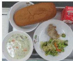
9/28 くるロールパン 鶏肉のマーメレード焼き 枝豆サラダ クラムチャウダー