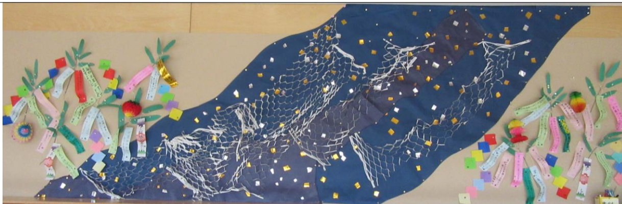
体育館出入り口の掲示板：天の川と七夕飾り

そして、少し離れたところに、はくちょう座のしっぽにあたるデネブという1等星があって、この3つの星が「夏の大三角形」をつくります。この夏、夜空をながめて、織姫・彦星のお話を思い浮かべながら、お星様を見てほしいなと思います。