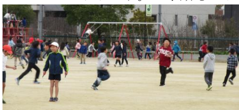
いっちータイム：運動場の様子

今朝は最低気温が「-2℃」の、この冬いちばんの冷え込みでした。外は指先から体の芯まで凍えそうな寒さですが、子どもたちは元気です。PTAの活動も今週早々からスタートしていただいております。3学期もよろしくお願いいたします。