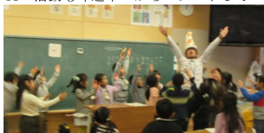
今日はパンの日：パンの先生登場！