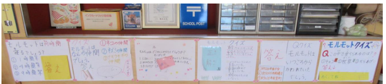
毎朝声をかけいただきありがとうございます!