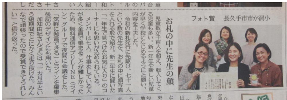
P T A新聞「フォト賞」・・・中日新聞（11/26 なごや東版）に掲載されました!