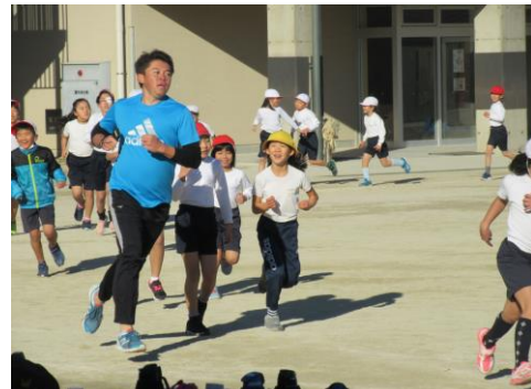
3年生と共にトップを独走する古澤先生も発見！