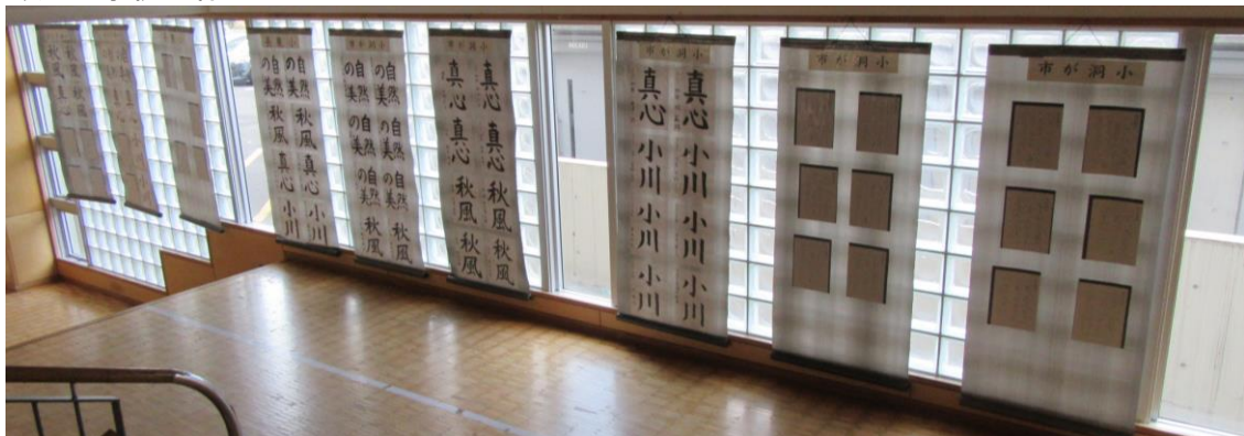
本館昇降口階段付近に展示されている尾教研書写コンクール特選作品