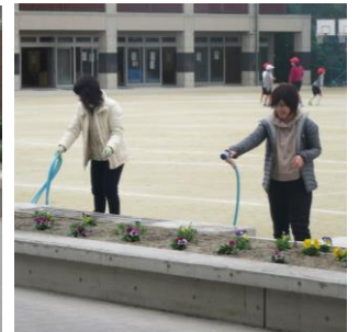
P T A花ボランティア・・・大変寒い日となりましたが、午前中、花壇の手入れをしてくださいました。