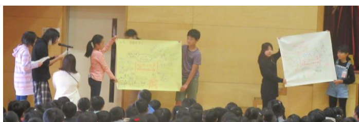
上：発表する保健委員 下：保健室前の掲示