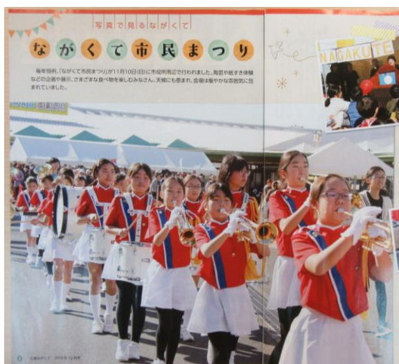
広報12月号に掲載されました!