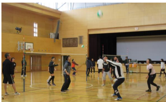
1/25 P T A ビーチボールバレー：教員チーム参戦