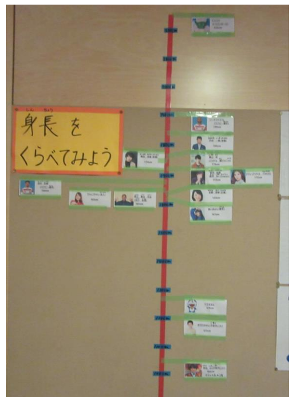
保健室前：身長をくらべてみよう