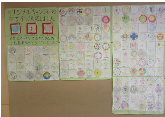
6年生の応募の中からオリジナルキャンディーデザイン決定