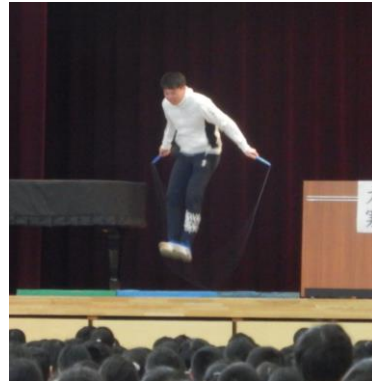
三重跳びの古澤先生