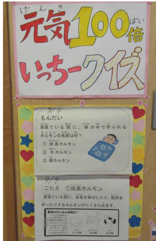
【元気100倍いっちークイズ】