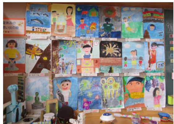
【3年生：夏休みの思い出】