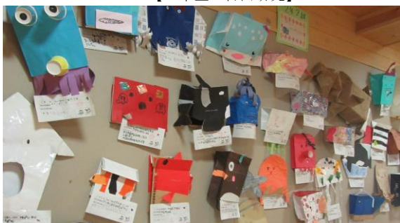
【2年生：ぼうしで すいぞくかん】