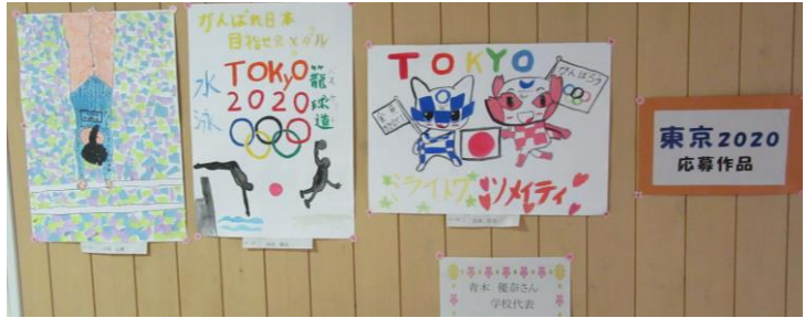
【東京2020応募作品：5年生】