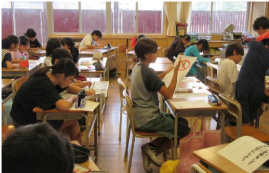
【掲示物を作成する保健委員会】

前期最後となる委員会です。前期の活動を振り返りながら反省会をしたり、常時活動の準備をしたりしました。全体の委員会は前期最後ですが、後期委員会が始まるまでは前期の活動が続きます。この1～2週間いい締めめの活動にしたいです。