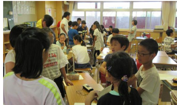
【グループで相談する交流委員会】