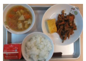
2/5 厚焼きたまご てっかみそ とうふ汁