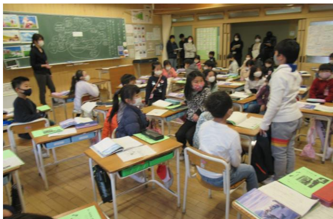
自分の考えや思いを伝え合う2年生