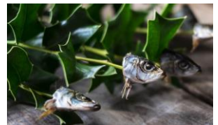
いわしの頭をさしたヒイラギ

2月2日は節分でした。節分にちなんで「いわし」と「節分豆」がつかまりました。いわしが出たのは、焼きたいわしの頭をさしたヒイラギの枝を家の入口にさしておく風習からきています。いわしの悪臭とヒイラギのトゲで鬼を追い払うとのこと。けんちん汁のカマボコにも鬼らしき顔が・・・いろいろと考えて工夫されていることがちょっとしたことから分かります。いつもありがとうございます。今週もおいしい給食ごちそうさまでした。