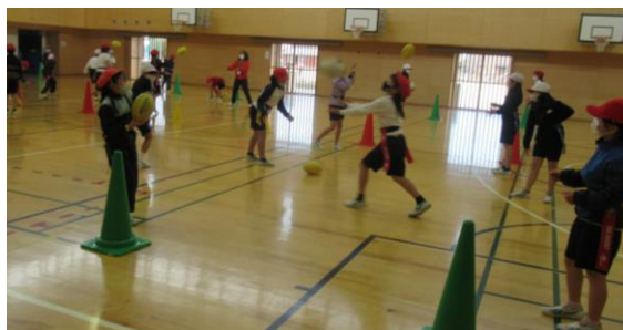
初めてのタグラグビーを楽しむ4年生の様子