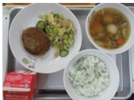
2/1 おろしハンバーグ 枝豆サラダ だんご汁 大根葉ふりかけ