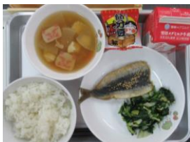
2/2 いわしのごま醤油和え いそか和え けんちん汁 節分豆