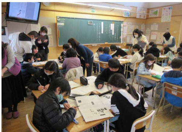
グループになって考えたり交流したりする4年生

2学期から学年ごとに授業研究を実施してきました。今年度はコロナ禍ではありましたが、話し合いを深める手立てについて研究を進めてきました。1年生から6年生まで発達段階が違うので、話し合いを深める手立ても様々です。授業研究にゴールはありません。これからも私たち教員同士が学び合いながら切磋琢磨し合いながら、授業力向上を図っていきます。