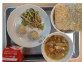
2/4 ちゃんぽんメン ショウロンボウ かふう和え