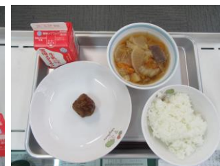
6/17 だいず入り肉団子 じゃがいものっぺいじる