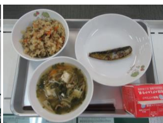
6/16 五目ご飯 いわしのうめに さわにわん