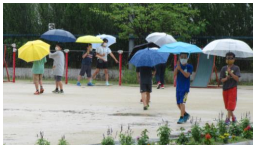
水たまりを観察する4年生

途中から雨が降り出しました。梅雨の時期とはいえ久しぶりの雨です。5時間目に傘を差して運動場を歩く4年生のクラスがありました。何をしているのか聞いてみると理科の学習で水たまりを観察しているとのこと。どんなところに水たまりができるのかを調べていたようです。雨が降ると外で遊ぶことができなかつたり、傘を差しての登下校でぬれてしまつたり、じめじめして過ごしにくかつたり…と、どちらかというとよくないイメージがあるかもしれませんが、うれしい雨もたくさんあるよなと考えたりしました。今日のはじめての1～4年生下校の日だったので、下校に関してはあいにくの雨となつてしまつたようです。