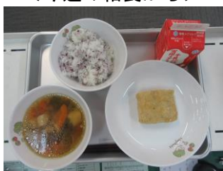
6/15 けんちんしのだのあんかけ とうもろこしのうすくずじる