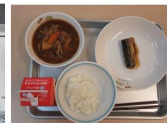
6/18 さんまのおかか にさつまじる