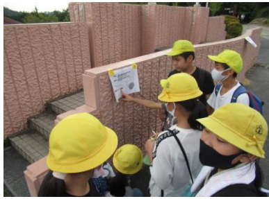
ゴール後の最後の課題！