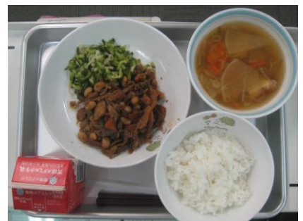
9/25 てっかみそ はりはりづけ よしの汁