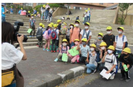
スタートしたら記念写真も!