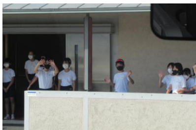
6年生も見送ってくれました!