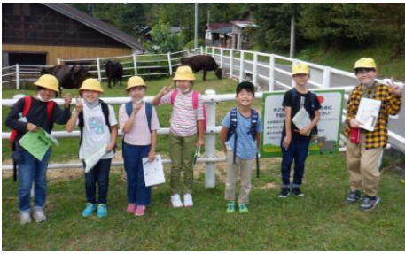
牛さんといっしょにポーズ！