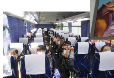
バスの中では静かにビデオ視聴(5号車)