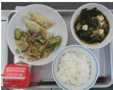
9/23 ぎょうざ はるさめサラダ 中華とうふ汁

24・25日は5年生の野外活動のため給食をいただくことができませんでしたが、送ってもらった写真を見て味を想像してみました。25日はてっかみその濃いめの味付けにキュウリと千切り大根の甘酸っぱい味付けがマッチしてごはんが進み・・・よしの汁の鶏肉や大根がまたちょうどいいあんばいで口の中に広がって思わず笑顔に・・・今週もごちそうさまでした。