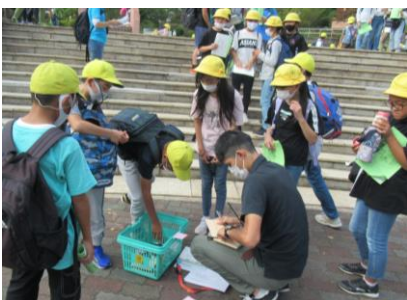
スタート時のチェック!

14時からウォークラリーです。班ごとに出発して、地図を見ながらチェックポイントを通して課題に答えていきます。「この小川の水温は?」「東海自然歩道の道しるべには、どんな植物の葉が描かれているか?」「森の中にある8つの台は、何に使う台でしょうか?」など、その場所で分かる内容の問題になっています。70分が目標タイムでありましたが、道に迷った班もあり(Bコースの班が多かったです)100分くらいかかってゴールした班もありました。山道をしっかり歩いてきているのでだいぶ疲れた様子ではありましたが、みんな笑顔でゴールしました。