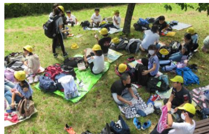
お弁当タイム:晴天です!日かげが恋しい...