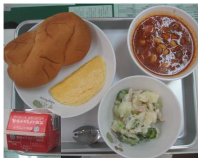
9/24 チキンビーンズ オムレツ ポテトサラダ クロスロールパン