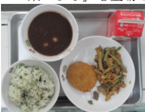
1/11 わかめご飯 キャベツ入りメンチカツ ごぼうのいり煮 ぜんざい

来週は…子どもたちに人気の「ABCスープ」や「カレーライス」が出ます。21日金曜は『愛知を食べる学校給食の日』です。愛知の郷土料理である「ひきずり」や長久手市の伝統野菜「まな」も登場します。来週も楽しみです！