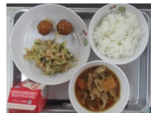
1/14 ごぼう入りつくね うめおかか和え 根菜のごま汁

★12月にゴミ減量のライブ配信があったときに、3年生の教室でストローを使わずに牛乳を飲んでいる児童がいたことを思い出し、トライしてみることにしました。開けるときは慎重になりドキドキしますが、牛乳を美味しくいただくことができます。やってみると分かることがあるものですね(*^▽^*)。できることからチャレンジです！