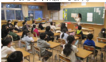
★本の読み聞かせ：2年生の教室

今日はPTA役員会や学年委員選出会もありました。今週は各部や各ボランティアの皆様も3学期の活動がスタートしているとのこと。今年度のまとめの時期となりましたが、3学期も「～できるときに できることを できる範囲で～」のスタンスで市小をお支えいただきますようよろしくお願いします。