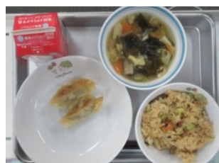
1/13 中華おこわ 焼きギョウザ 中華とうふ汁