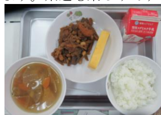
1/12 厚焼き卵 てっかみそ よしの汁