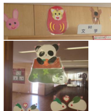
★図書室の掲示が1月からの3学期バージョンにリニューアルされています。いつもありがとうございます!