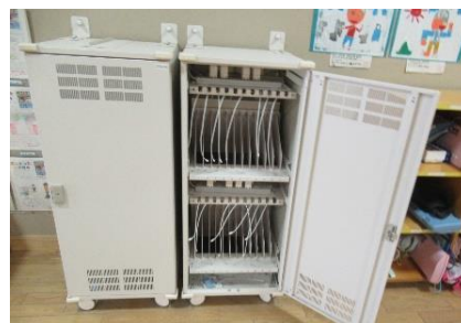
★タブレット保管庫