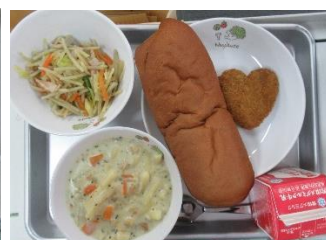
2/8 黒ロールパン パンプキンコロッケ ごぼうサラダ マカロニのクリーム煮