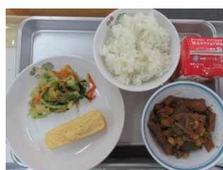
2/9 厚焼きたまご 小松菜のおひたし てっかみそ