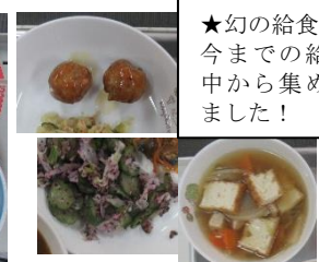
2/10 レンコンつくね キュウリの赤しそ和え よしの汁