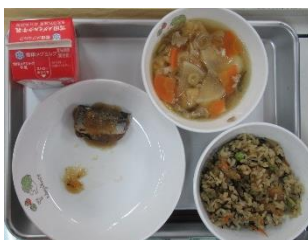
2/7 ひじきごはん さんまのみぞれ煮 のっぺい汁

来週は火曜日の「カレーうどん」がスタートになります。さわりにギョウザにお好みどんぶり…楽しみにしたいです。