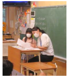
★教室やワークスペースでは、一人一人が担任の先生から通知表を受け取っていました。その間にタブレットを活用しているクラスも見られました。