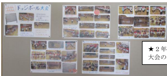
★2年生昇降口前の掲示板・・・先週のドッジボール大会の様子が写真で紹介されています！