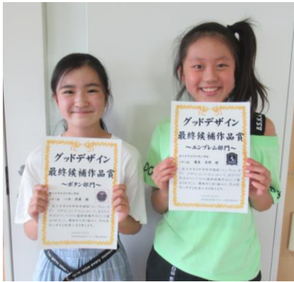
★終業式後は、グッドデザイン最終候補作品賞「ボタン部門とエンブレム部門」の2人に教室で賞状を渡しました。記念に笑顔の1枚です！