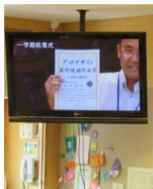
★グッドデザイン表彰！