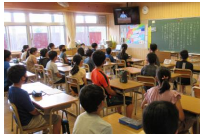
★6年生の教室の様子