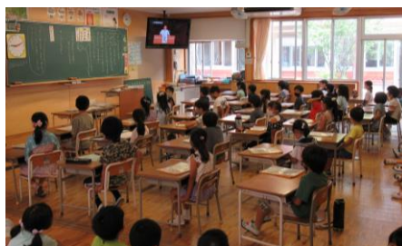
★1年生の教室の様子