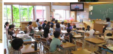
↑ 3年生の教室 ← 4年生の教室