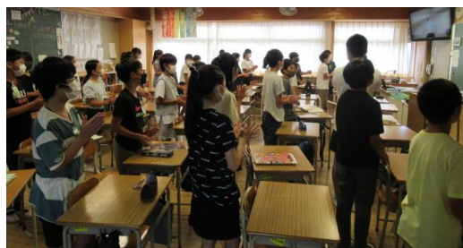
★久しぶりに校歌を歌いました。少し間隔をとりました。★↑体育館での5年生・2年生の様子