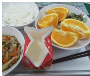
7/19 野菜たっぷり豚丼 和風ツナサラダ オレンジ ごはん 牛乳