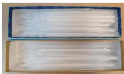
★牛乳ストローなしチャレンジで、いっぱいストローが貯まりました！(▽)