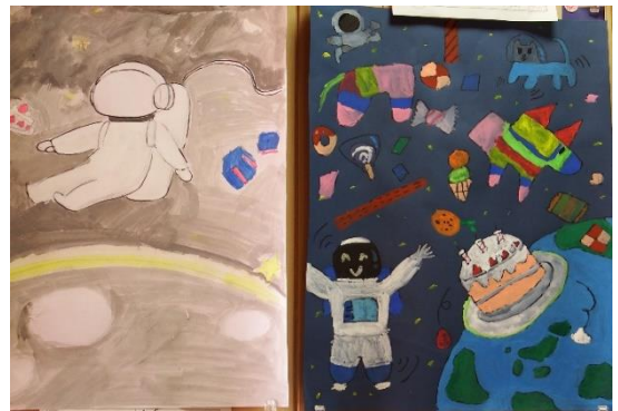
【6年生】「月でたんじょうパーティーをひらいたら」月といえばウサギ、宇宙飛行士、ロケット、それとも宇宙人！？思いっきり楽しんでパーティーの様子を描きました。

「何かがゴミを正しくしてなかったせいで、海がよごれてしまって、生き物もたくさん死んでしまっていることを知ったので、これからはみんなで協力して正しくゴミをすてようと思いました。」