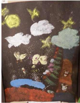
【4年生】「木の祭り」「天の火をぬすんだウサギ」絵の細部まで書き込んだり、スパッタリングなどの技法を使ったりして描き上げました。