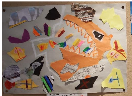
「さかなのかけっこ」

新聞紙や包装紙、画用紙などのいろいろな紙を好きなようにびりびりと破きました。破いた紙から浮かんできたイメージで絵を仕上げました。紙をくしゃくしゃにしてみたり、画用紙からはみ出してはったり、紙の上からもクレヨンで描き込んだり、豊かな発想で楽しい作品を作り上げました。