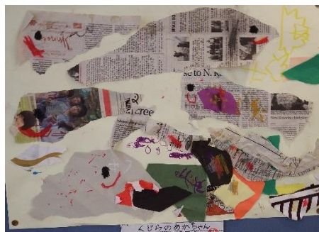
「くじらのあかちゃん」