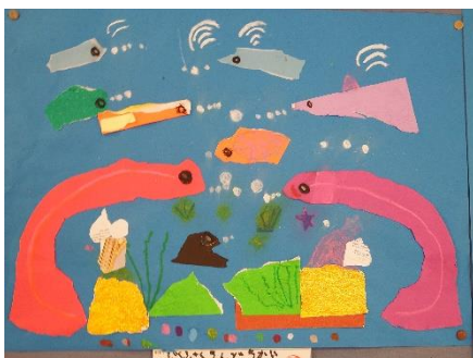
「ぶくぶくうんどうかい」