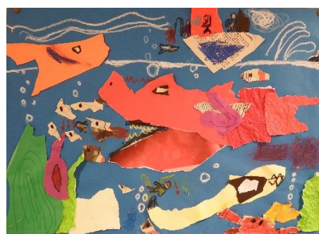
「たのしいさかなつり」

白、赤、黄、青の紙粘土を使って、お寿司、ケーキ、ドーナツ、マカロン等、大好きな食べ物を作りました。粘土を混ぜて色もつくり、持ってきた紙皿や紙コップに彩りよく盛り付けました。イチゴのつぶつぶ、エビのしっぽ、サーモンの色合い、生クリームのおふんわり感等、おいしく本物っぽく見えるようにこだわりました。