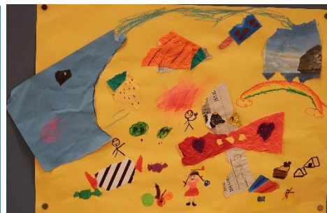
「たべられちゃうよー」