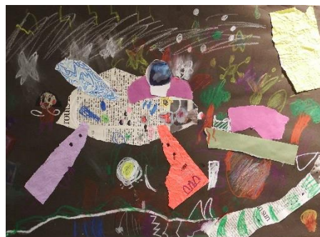
「いぬのおおきなはねとにんげん」