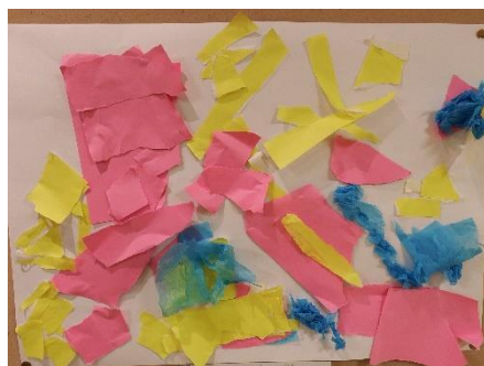
「おおむかしのじゃんぐる」