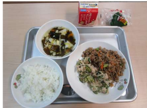
5/1の給食 わかたけじる